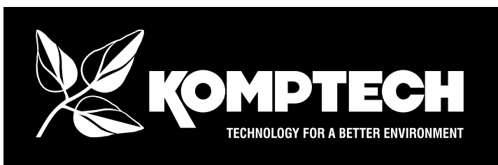
LOGO MIT CLAIM NEGATIV